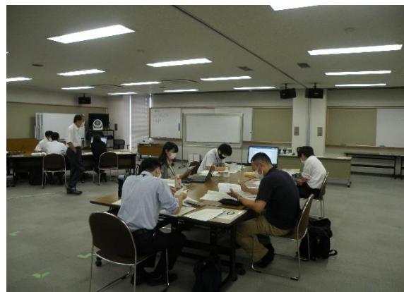
2日目 グループ演習